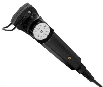
Tradiční dálkový ovladač pro nastavení proudové intenzity pro MMA 3